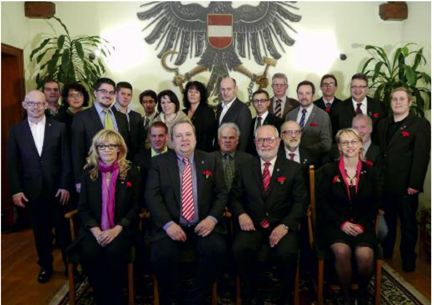
Bürgermeister, Vizebürgermeister und alle Mitglieder nach der konstituierenden Sitzung am 4. März.

Für eine lebenswerte Gemeinde MITREDEN ★ MITENTSCHEIDEN ★ MITARBEITEN