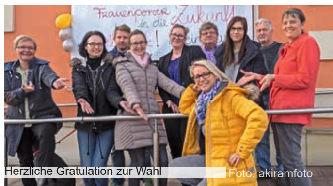
Herzliche Gratulation zur Wahl