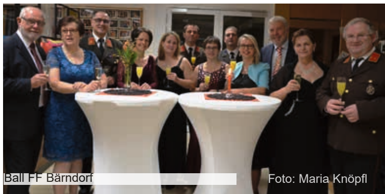
Ball FF Bärndorf