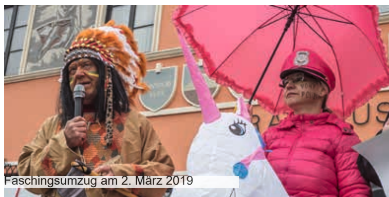
Faschingsumzug am 2. März 2019