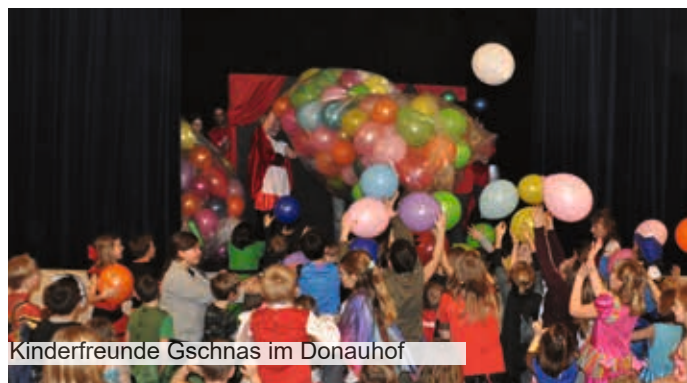
Kinderfreunde Gschnas im Donauhof