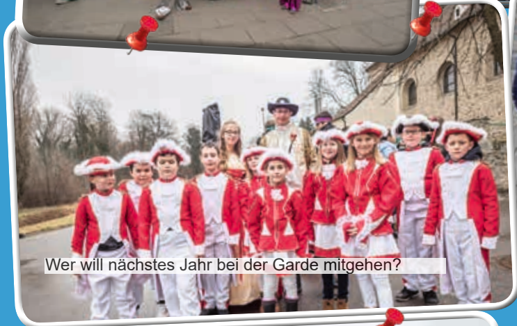
Wer will nächstes Jahr bei der Garde mitgehen?