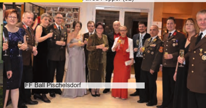
FF Ball Pischelsdorf